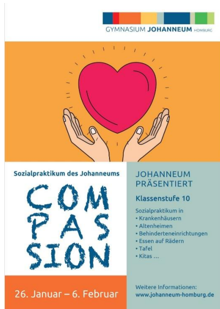
COMPASSION (26.1. – 6.2.)