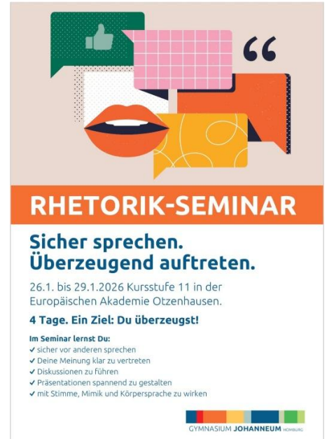
RHETORIKSEMINAR (26.1. – 29.1.)