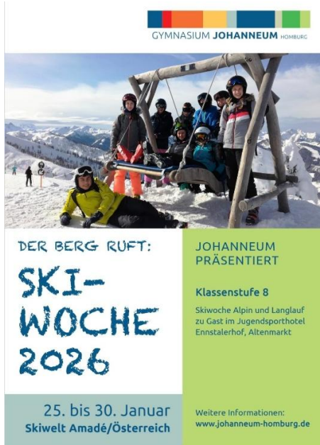
SKIWOCHE (25.1. – 30.1.)